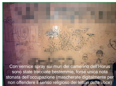
Con vernice spray sui muri del camerino dell'Horus sono state tracciate bestemmie, forse unica nota stonata dell'occupazione (mascherate digitalmente per non offendere il senso religioso dei lettori della Voce)

Horus, gli occupanti vogliono restare per i precari della cultura e per chi fa ricerca