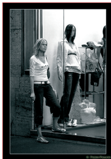
ZOOBAR in via Bencivenga 1 (angolo via Nomentana) - ingresso libero - info: 339/27.27.995 - 338/87.81.118