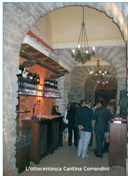
L'ottocentesca Cantina Comandini