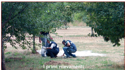
I primi rilevamenti

E' passato più di un anno dall'omicidio. Pensa che sia possibile oggi rinvenire nuovi indizi tali da far supporre la colpevolezza di qualcuno? Nell'arco di 48 ore dall'o-