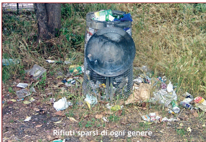
Rifiuti sparsi di ogni genere

T ra i parchi naturali di Roma-Natura, l'Ente Regionale per la Gestione delle Aree Naturali protette nel Comune di Roma, c'è la Riserva Naturale della Valle dell'Aniene, istituita con Legge Regionale 29/1997, di cui fa parte anche il Pratone delle Valli. All'inizio del 2005, l'inaugurazione del Pratone con la presenza del sindaco Veltroni era sembrato l'inizio di una riappropriazione dell'area da parte dei cittadini dopo anni di abbandono e di lotte per strapparla alla cementificazione. Sono cominciati i lavori di adeguamento, peraltro ancora in corso e i cittadini si sono abituati a portarvi i bambini perché giocano nelle aree attrezzate, o i cani perché possano corrervi liberamente. Sembrerebbe un quadretto quasi idilliaco, eppure è sufficiente spostarsi qualche metro più in là per rendersi conto che il parco momentaneamente è terra di nessuno. Entrando dall'ingresso di via Conca d'Oro, in prossimità del ponte delle Valli, a mano a mano che ci si inoltra nella vegetazione, dapprima cartacce e lattine, poi, più in là, grandi buste piene di bottiglie di birra vuote, per passare infine a batterie di automobili, pneumatici ed elettrodomestici fuori uso.